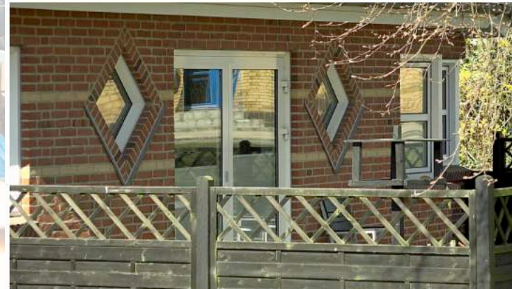
Fleere langtidssygemeldinger på grund af vold i bofællesskabet Under Bøgen i Aalestrup koster Vesthimmerlands Kommune dyrt. Foto: Jesper Christiansen

Socialtilsyn retter skarp kritik af Bofællesskabet Rosenvænget 10 efter et uanmeldt tilsyn sidste sommer. Foto: Jesper Christiansen