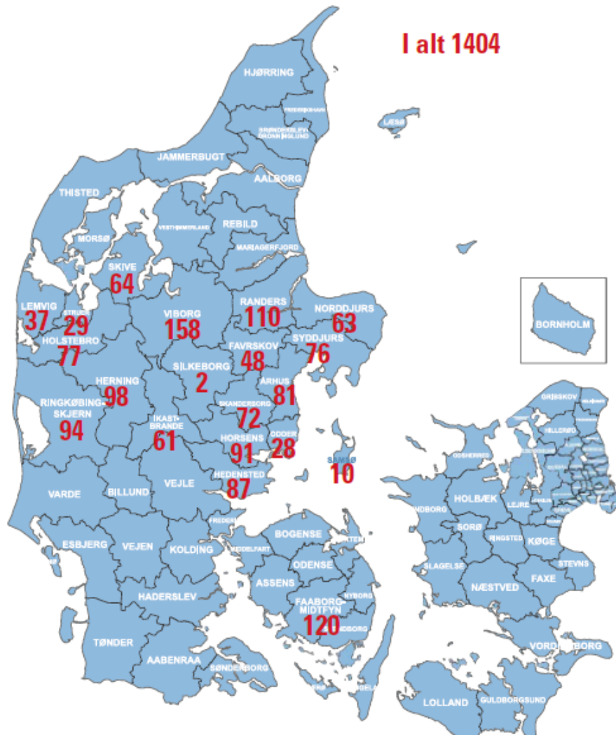
Tabel 2.2. Oversigtskort over plejefamilier fordelt på kommuner